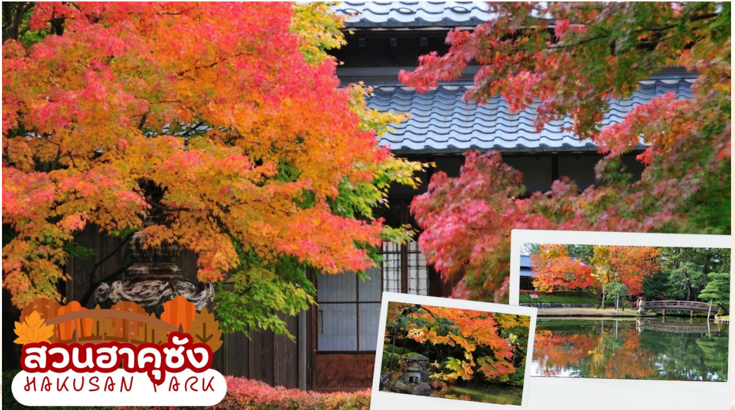
สวนฮาคุซัง HAKUSAN PARK

สวนฮาคุซัง (Hakusan Park) เป็นสวนสาธารณะประจำเมืองนิงะตะ ที่ออกแบบโดยได้รับแรงบันดาลใจจากชาวดัตช์ ตั้งอยู่ติดกับ ศาลเจ้าฮาคุซัง (Hakusan Shrine) และได้รับการยอมรับว่าเป็นหนึ่งในสวนสาธารณะในเมือง 100 อันดับแรกของญี่ปุ่น สวนมีความงามตามฤดูกาลที่หลากหลาย เช่น ดอกซากุระในฤดูใบไม้ผลิ ดอกบัวในฤดูร้อน ใบไม้เปลี่ยนสีในฤดูใบไม้ร่วง และหิมะในฤดูหนาว (ใบไม้เปลี่ยนสีขึ้นอยู่กับสภาพอากาศ)