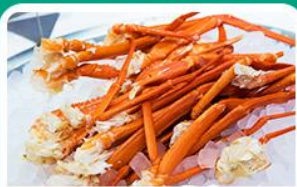
พิเศษ! บุฟเฟ่ต์ขาปู