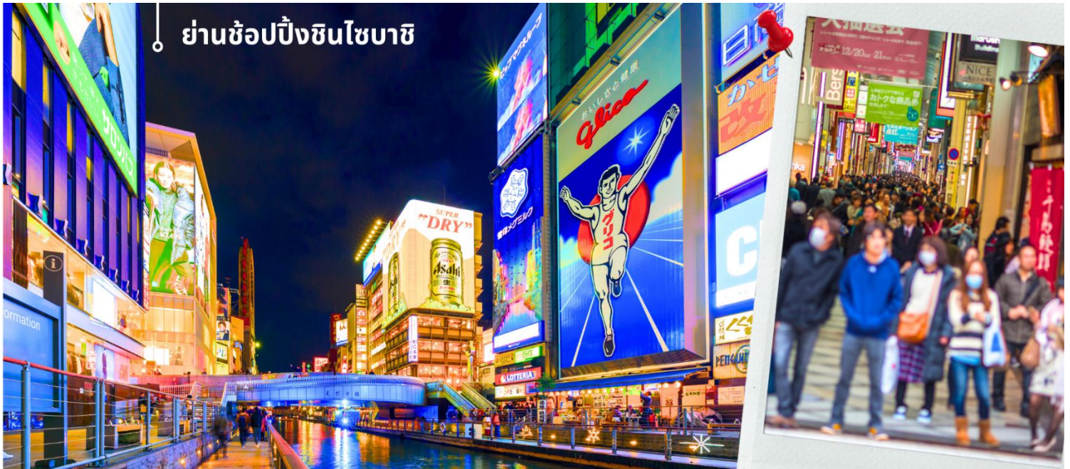
ย่านช้อปปิ้งชินไซบาชิ

สมควรแก่เวลานำท่านเดินทางสู่ ย่านช้อปปิ้งชินไซบาชิ Shinsibashi ชื่อตั้งของโอซาก้า มีร้านค้าทั้งเก่าแก่และทันสมัย สินค้าหลากหลายรูปแบบสำหรับเด็กและผู้ใหญ่ เป็นย่านแสงสีและความบันเทิงอีกแห่งหนึ่งของโอซาก้า อีกทั้งยังมีร้านอาหารขึ้นชื่อมากมาย ซึ่งเสน่ห์ อย่างหนึ่งของที่นี่คือ ร้านจะประดับตกแต่งร้านของตนเองด้วยแสงไฟนีออนซึ่งจัดทำให้เป็นรูปปู กุ้ง และปลาหมึก ซึ่งนักท่องเที่ยวให้ความสนใจและแวะถ่ายรูปกันเป็นที่ระลึก ข