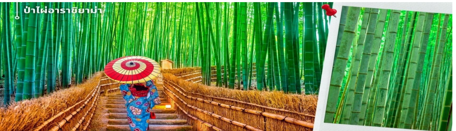
ป่าไผ่อาราชิยาม่า

หลังรับประทานอาหารเที่ยง นำท่านเดินทางสู่ ป่าไผ่อาราชิยาม่า ซึ่งอยู่ไม่ไกลจากสะพานโทเก็ตสึเคียว ป่าไผ่แห่งนี้มีต้นไผ่ที่ใหญ่ที่สุดในญี่ปุ่น ทั้งสวยและโตงดงที่สุดในประเทศญี่ปุ่น โดยตลอดสองข้างทางนั้นจะมีต้นไผ่สีเขียวขจีสูงเสียดฟ้า ยาวกว่า 10 เมตร เรียงรายอยู่เป็นระยะทางประมาณ 500 เมตร ที่จะทำให้เราได้สัมผัสกับเสียงต้นไผ่ที่กระทบกันให้ความร่มรื่น สงบ เย็นสบาย และแสงที่ลอดผ่านต้นไม้ให้ความรู้สึกอบอุ่น เป็นเสน่ห์อีกอย่างหนึ่ง ให้ท่านได้เดินชมและเก็บภาพความประทับใจเป็นที่ระลึก