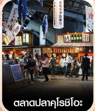
ตลาดปลาคุโรชิโอะ