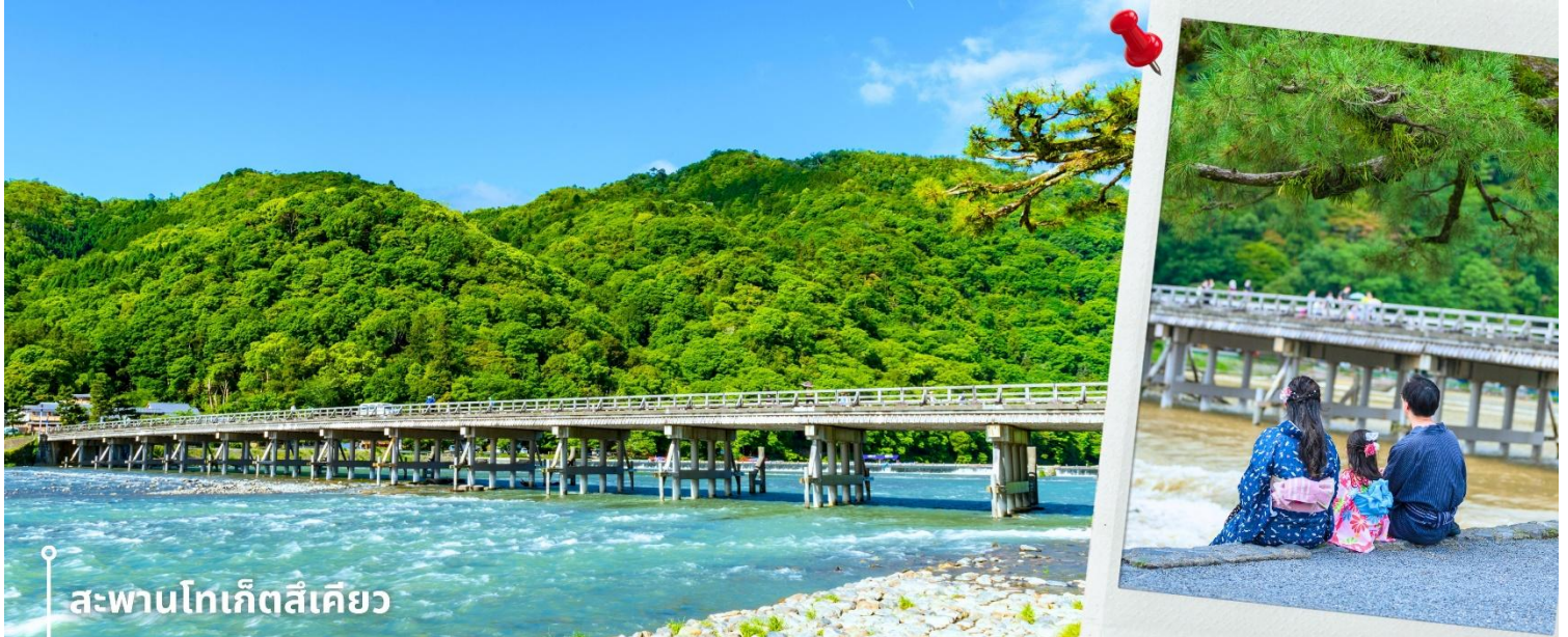
สะพานโทเก็ตสึเคียว

จากนั้นนำท่านสู่ สะพานโทเก็ตสึเคียว ตั้งอยู่ในบริเวณอาราชิยาม่า จังหวัดเกียวโต เป็นสะพานข้ามแม่น้ำคัตสึระ (Katsura River) ตัวสะพานโทเก็ตสึเคียวดั้งเดิมนั้นเป็นสะพานไม้ทั้งหมด สร้างขึ้นในปี ค.ศ. 836 ส่วนสะพานที่เห็นในปัจจุบันนั้นสร้างขึ้นเมื่อปี ค.ศ. 1934 มีความยาว 155 เมตร และความกว้าง 12.2 เมตร โดยมีการสร้างให้ช่วงฐานเป็นคอนกรีตเสริมเหล็ก แต่ยังคงใช้ราวสะพานไม้เพื่อคงเอกลักษณ์ดั้งเดิมไว้ ที่สะพานแห่งนี้ ท่านจะได้สัมผัสบรรยากาศธรรมชาติที่รายล้อมไปด้วยต้นไม้อายุชะอุ่ม ทิวบริเวณโดยรอบ สูดอากาศอันสดชื่น และชมวิวธรรมชาติที่งดงามอย่างเต็มที่ ให้ท่านอิสระเก็บภาพความสวยงามและดื่มด่ำกับบรรยากาศตามอัธยาศัย