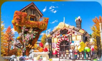
โรงงานช็อกโกแลต ชิโรอิ โคอิบิโตะ