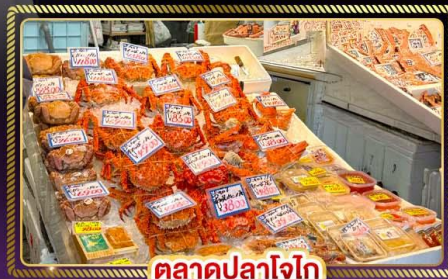
ตลาดปลาโอโก