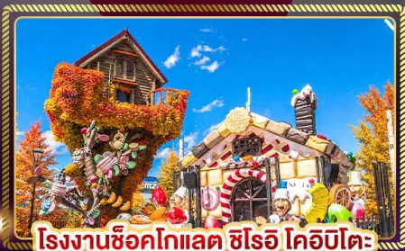
โรงงานช็อคโกแลต ชิโร โคอิบิโตะ