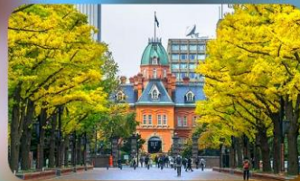
อัสระตามอริยาศัย 1 วัน