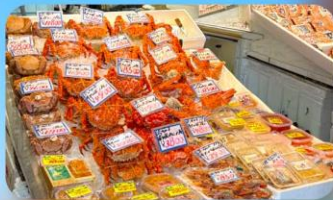
ตลาดปลาโจโก