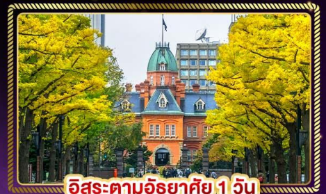
ฮิโรสะตามอริยาตสึ 1 วัน

🧳 น้ำหนักกระเป๋า 20 Kg. บริการอาหาร บนเครื่องบิน