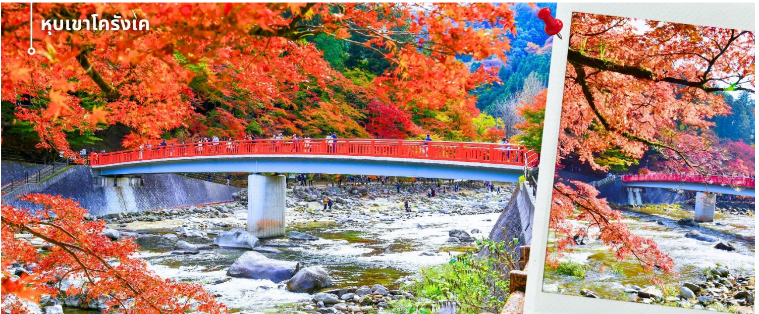
หุบเขาโครังเค

หลังรับประทานอาหารเที่ยงนำท่านเดินทางสู่ หุบเขาโครังเค (Korankei Gorge) ตั้งอยู่ในเมืองโทโยตะ เป็นหนึ่งในจุดชมใบไม้เปลี่ยนสีที่มีชื่อเสียงที่สุดแห่งหนึ่งของญี่ปุ่น โดดเด่นด้วยต้นเมเปิ้ลจำนวนมากที่ปลูกเรียงรายตลอดแนวแม่น้ำโทโมเอะ ทำให้เมื่อถึงฤดูใบไม้ร่วง พื้นที่ทั้งหุบเขาจะถูกแต่งแต้มด้วยสีแดงสด ส้ม และเหลืองอย่างงดงาม ไฮไลท์สำคัญของที่นี่คือ สะพานแดงไทเก็ตสึเคียว (Taigetsukyo Bridge) สะพานไม้สีแดงที่ทอดข้ามสายน้ำใจกลางหุบเขา ซึ่ง