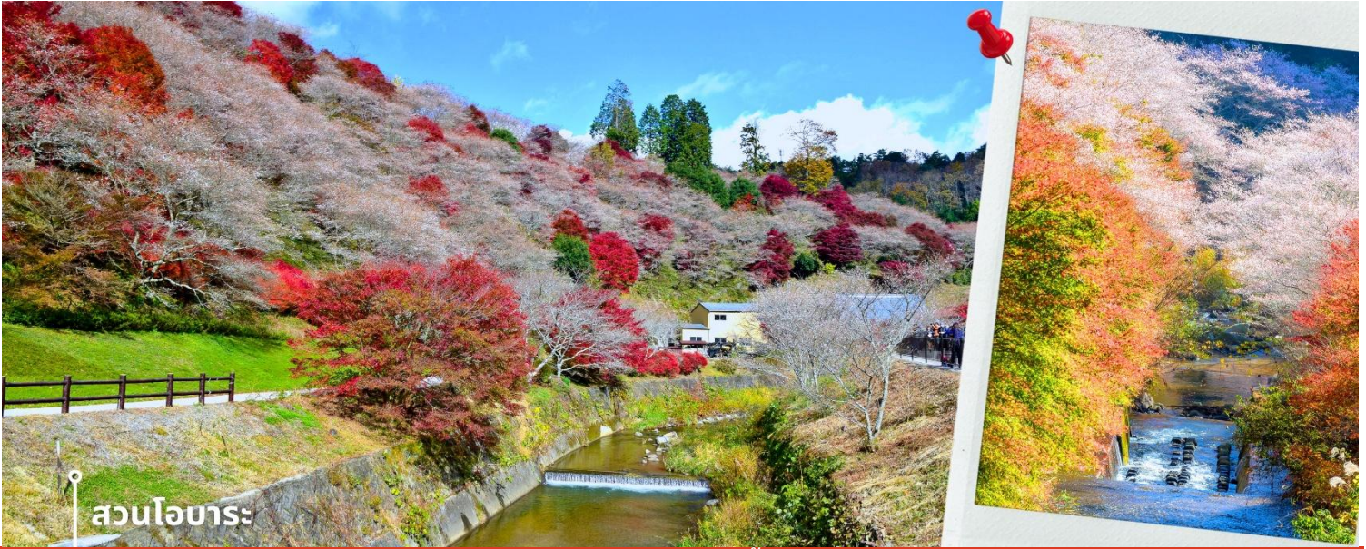
สวนโอบาระ

จากนั้นนำท่านเดินทางสู่ สวนโอบาระ ฟูเรโอ ตั้งอยู่ในเขตโอบาระ เมืองโทโยตะ จังหวัดไอจิ เป็นสถานที่ท่องเที่ยวที่มีเอกลักษณ์โดดเด่นจากการชม “ซากุระสองฤดู” โดยสวนนี้ปลูกต้นซากุระอยู่โดยรอบที่ว่าการประจำเมืองสาขาโอบาระ ซึ่งอยู่ติดกับสวนราว 300 ต้น โดยจะบานในฤดูใบไม้ผลิ ช่วงกลางมีนาคม-ต้นเมษายน และในฤดูใบไม้เปลี่ยนสี ช่วงปลายตุลาคม-ธันวาคม ซึ่งในช่วงปลายปี ดอกซากุระจะผลิบานควบคู่ไปกับใบไม้เปลี่ยนสี สร้างทัศนียภาพที่ผสมผสานระหว่างสีชมพูอ่อนของซากุระ และโทนสีแดง ส้ม เหลืองของใบไม้ได้อย่างสวยงามและหาชมได้ยาก บรรยากาศภายในสวนรายล้อมด้วยธรรมชาติและภูเขา มีความร่มรื่นและเงียบสงบ เหมาะสำหรับการเดินชมทิวทัศน์ และถ่ายภาพ โดยจุดเด่นอยู่ที่การได้สัมผัสความงดงามของสองฤดูกาลในเวลาเดียวกัน ทำให้สวนแห่งนี้เป็นสถานที่ที่เหมาะสมสำหรับผู้ที่ต้องการชมซากุระในบรรยากาศที่แตกต่างจากช่วงฤดูใบไม้ผลิ ซึ่งจะได้เพลิดเพลินกับทัศนียภาพของซากุระที่แสนงดงาม พร้อมกับวิวใบไม้แดงสีสนสดใสในช่วงเวลาเดียวกัน