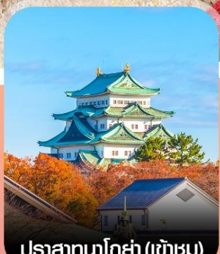
ปราสาทนาโงย่า (เขาม)