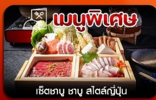
เชิ่ตเมนู พิเศษ เชิ่ตเมนู พิเศษ