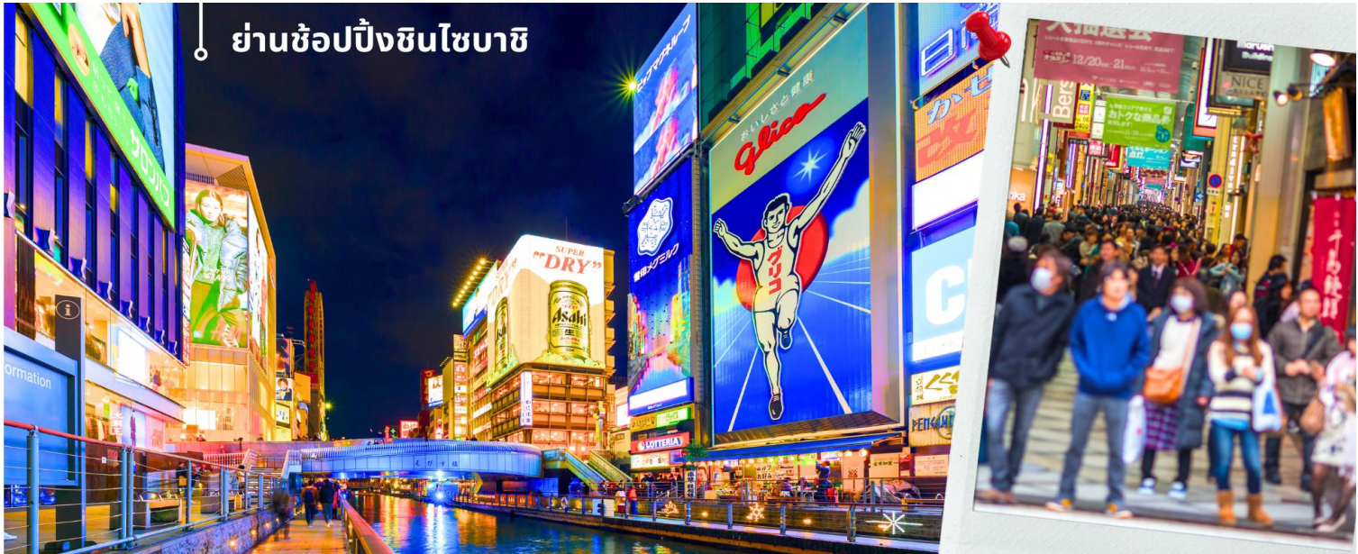
ย่านช้อปปิ้งชินไซบาชิ

หลังจากนั้นนำท่านเดินทางสู่ ย่านช้อปปิ้งชินไซบาชิ Shinsibashi ชื่อดังของโอซาก้า มีร้านค้าทั้งเก่าแก่และทันสมัย สินค้าหลากหลายรูปแบบสำหรับเด็กและผู้ใหญ่ เป็นย่านแสงสีและความบันเทิงอีกแห่งหนึ่งของโอซาก้า อีกทั้งยังมีร้านอาหารขึ้นชื่อมากมาย ซึ่งเสน่ห์ อย่างหนึ่งของที่นี่คือ ร้านจะประดับตกแต่งร้านของตนเองด้วยแสงไฟนีออนซึ่งจัดทำให้เป็นรูปปู กุ้ง และปลาหมึก ซึ่งนักท่องเที่ยวให้ความสนใจและแวะถ่ายรูปกันเป็นที่ระลึก