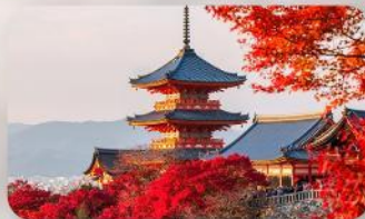
วัดคิโยมิชิ