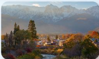
โออิเดะ ปาร์ค