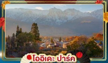
ไอฮิเดะปาร์ค