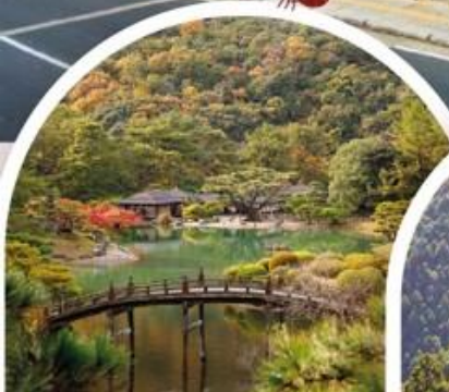
สวนริกสึริน