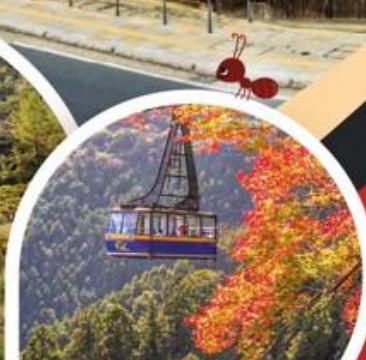
นั่งกระเช้า วัดโทริวจิ

โทเบ ◦ โทคุชิม่า ◦ ทาคามัตสึ ◦ โคโตะฮิระ ◦ มัตสึยาม่า ◦ โอซาก้า