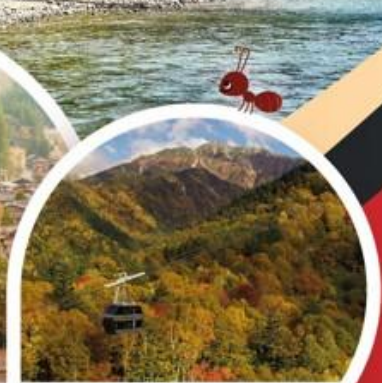
กระเช้าชินโอสากะ