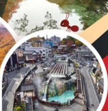
คุซุกัสึ ออนเซ็น