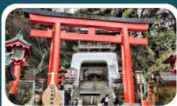
ศาลเจ้าอินะฮิมะ