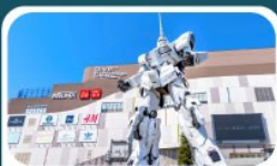
ห้างไดเวอร์ซิตี