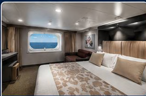
OCEAN VIEW ROOM