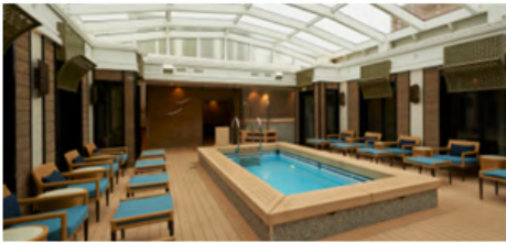
The Haven By Norwegian®