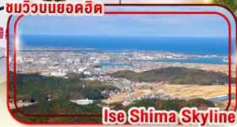
Ise Shima Skyline