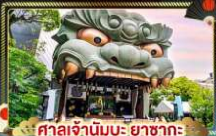
ศาลเจ้านัมมะ ยาชากะ