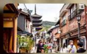
ถนนกาน้ำชา