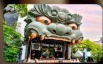
ศาลเจ้านิมบะ ยาชากะ