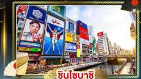
ชินโซฮาชิ