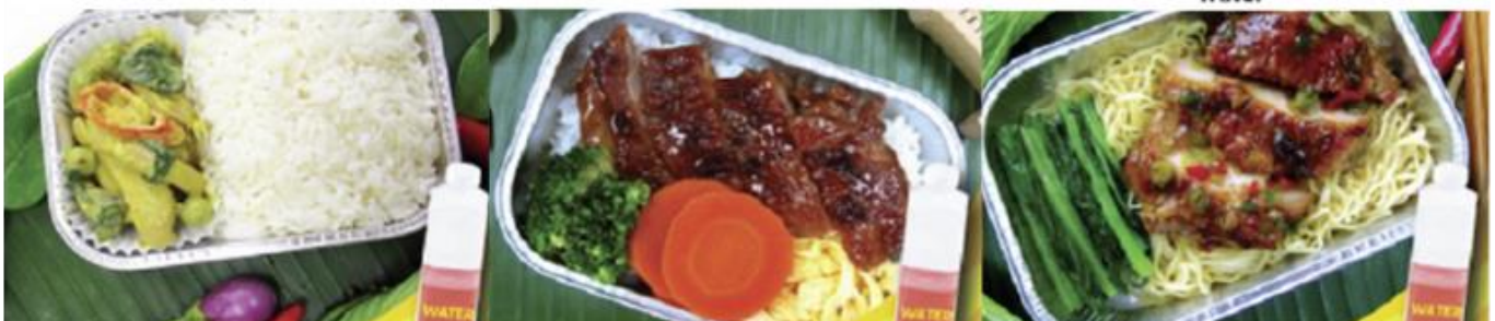
Chicken roasted with herb and noodle and water