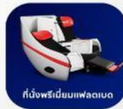
ที่นั่งพรีเมียมแพลตบด