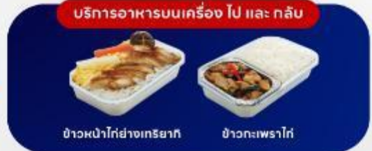
บริการอาหารบนเครื่อง ไป และ กลับ