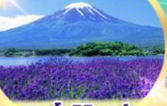
สวนโออิชิ พาร์ค