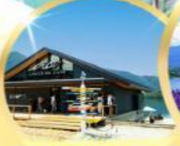
AO LAKESIDE CAFE