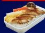
ข้าวหน้าไก่ย่างเทรยาท์