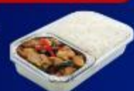
ข้าวกะเพราไฟ