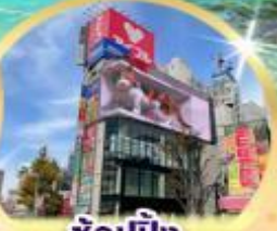
ช้อปปิ้ง ย่านชินจูกุ