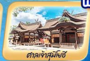
ศาลเจ้าสุมิโยชิ