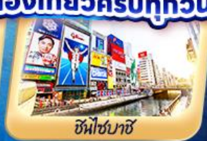
ชินโซบาช