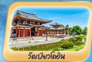
วัดเป็ชวาไดอิน