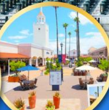
โทซุ พรีเมียม เอ้าท์เล็ตส์