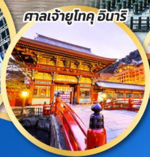
ศาลเจ้ายูโทกุ อินาริ