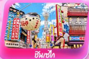
ชินเซโกะ