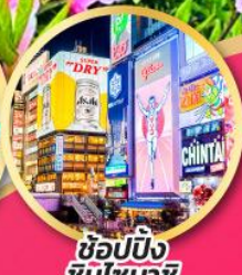
ช้อปปิ้ง ชินไซบาชิ

เที่ยวเต็มทุกวัน ไม่มีฟรีเดย์ บินเข้านาโกย่า-ออกโอซาก้า