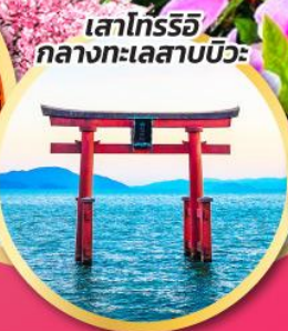
เสาโทริอิ กลางทะเลสาบบิวะ