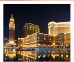
เดอะ เวเนเชียน มาเก๊า