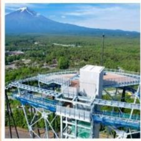
ฟูจิยามะ ทาวเวอร์