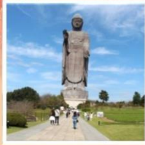
พระพุทธรูปอุชิคุไดบุทสึ