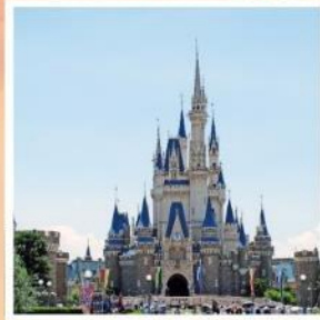
โตเกียว ดิสนีย์แลนด์