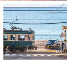
รถไฟโอะโนะเด็น

วัดนาริตะ / อีออน พลาซ่า / ฟุจियามะ ทาวเวอร์ / โอชิโนะ ฮักโก สวนโออิชิ ปาร์ค / นั่งรถไฟโอะโนะเด็น / วัดฮาเซดะระ / วัดโกโตคุอิน ซ้อปบิ้งซันจุกุ / โตเกียว ดิสนีย์แลนด์ (รวมค่าบัตรเข้า) พระพุทธรูปอุซุคุโดบุทสึ / อามิ พรีเมียม เฮ้าส์ / วัดปากง เซนาโต้สแควร์ / วัดอาม่า / เดอะเวเนเชียน / เดอะ ลอนดอนเนอร์