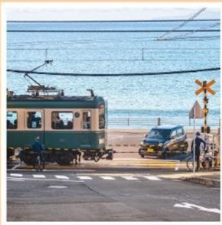
รถไฟเอโนะเด็ตสึ