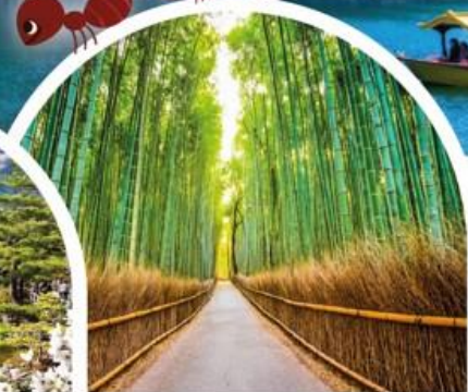
ป่าไผ่อาราชิยาม่า