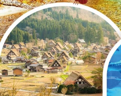
หมู่บ้านชิราคาวาโกะ