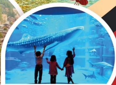
พิพิธภัณฑ์สัตว์น้ำไคยุคัง

โอซาก้า ◦ เกียวโต ◦ อินุยามะ ◦ ทิฟู ◦ ทาคายามา ◦ นากาโน่ ◦ โตเกียว