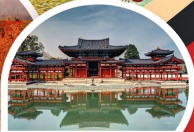
วัดเบียวโดอิน

นาโกย่า ◦ ฮิโรชิมะ ◦ ทาคายามา ◦ คามิโคจิ ◦ ทาเคยาม่า ◦ อุจิ ◦ โอซาก้า