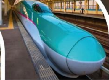
นั่งรถไฟชินคันเซ็น

📶 Wifi on bus 💧 บริการน้ำดื่ม 👤 10 คน ออกเดินทาง