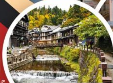
กินชังออนเซ็น