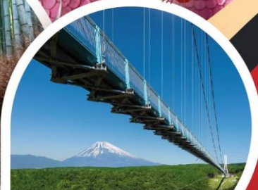
สะพานมิซึมาสกายวอล์ค