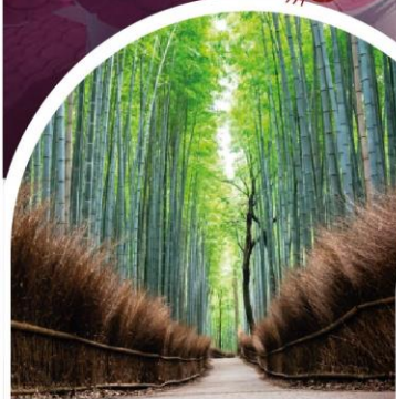
ป่าไฟ อาราชิยาม่า