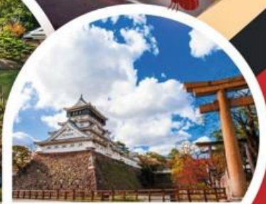
ปราสาทโคคุระ

ฟุกุโอกะ ◦ คิตะคิวชู ◦ ฮิโรชิม่า ◦ มัตสึยามะ ◦ ทาคามัตสึ ◦ คุราซึกิ ◦ โอซาก้า