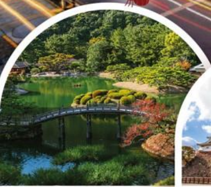
สวนริทสึริน