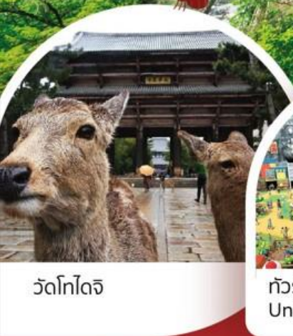
วัดโทไดจิ