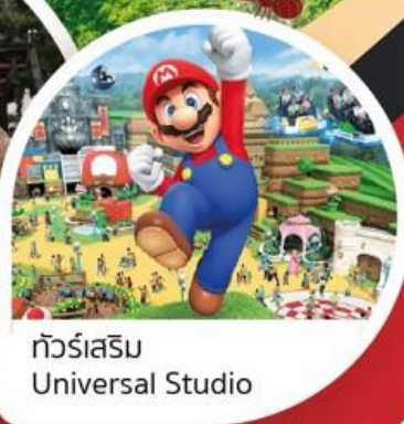
ทิวรี่เสริม Universal Studio