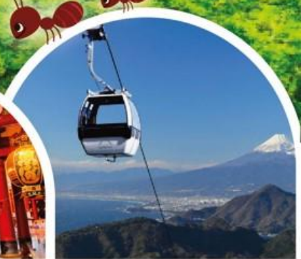
IZU PANORAMA ROPEWAY