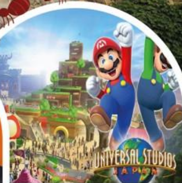
ทิวส์เสริมยูนิเวอร์แซล