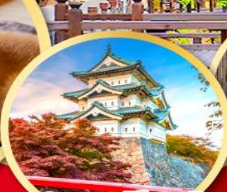
ปราสาทฮิโรซากิ