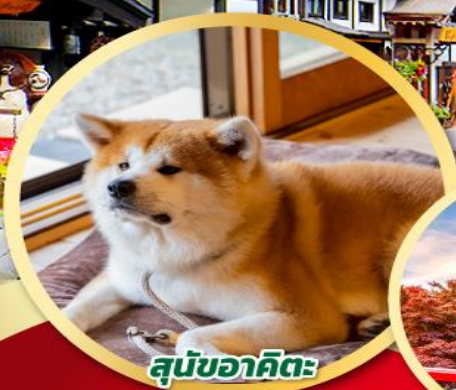
สุนัขอากิตะ