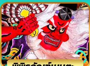
พิพิธภัณฑ์เบบุดะ