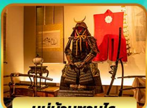
หมู่บ้านซามูไร