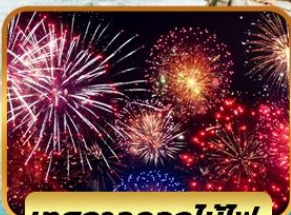
เทศกาลดอกไม้ไฟ