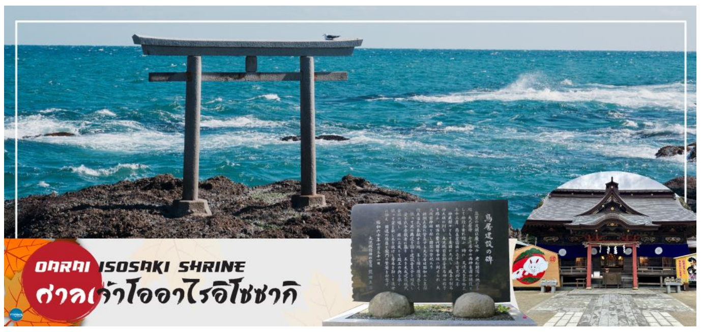
OHARAI ISOSAKI SHRINE ศาลเจ้าโออาไรอิโซซากิ

วันที่สอง ท่าอากาศยานนานาชาตินาริตะ ประเทศญี่ปุ่น – เมืองอิบารากิ – ตลาดปลาโออาไร – ศาลเจ้าโออาไรอิโซซากิ – เมืองกุนมะ – คุซัตสึออนเซ็น – ยูมาทาเกะ – ออนเซ็น