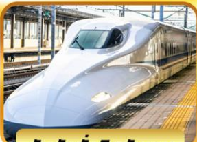
สัมผัสนั่งชินกันเซน