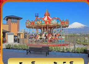
โกเท็มบะเจ้าท์เล็ต