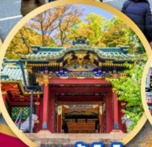
ศาลเจ้าโทโชคุ