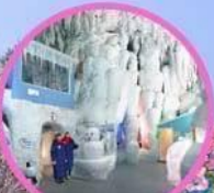
ไอซ์ พาวลเคียน