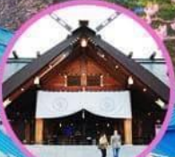
ศาลเจ้าออกโทโด