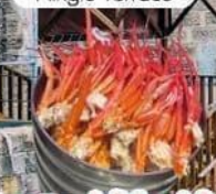
พิเศษ! บุฟเฟ่ต์ซาปูซูโง