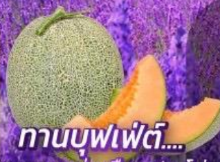
ทานบุฟเฟ่ต์... เมลอนแห่งเมืองฟูราโนะ

📍 ไฮไลท์!! ละลานตาไปกับดอกไม้หลากสายพันธ์ ณ ซึคิโฮโมะโอะกะ เทศกาลฤดู ลาวเอนเดอร์ ณ โทมิคะฟาร์ม (ขึ้นอยู่กับสภาพอากาศ) เป็นพระพุทธรเจ้า ชมความงามของสถานที่และพุทธศาสนาในมุมมองใหม่ อึ้งอึ้งอึ้ง!!! บุฟเฟ่ต์ชาบู+ชาบูยักษ์แห่งเกาะซอกโกโต