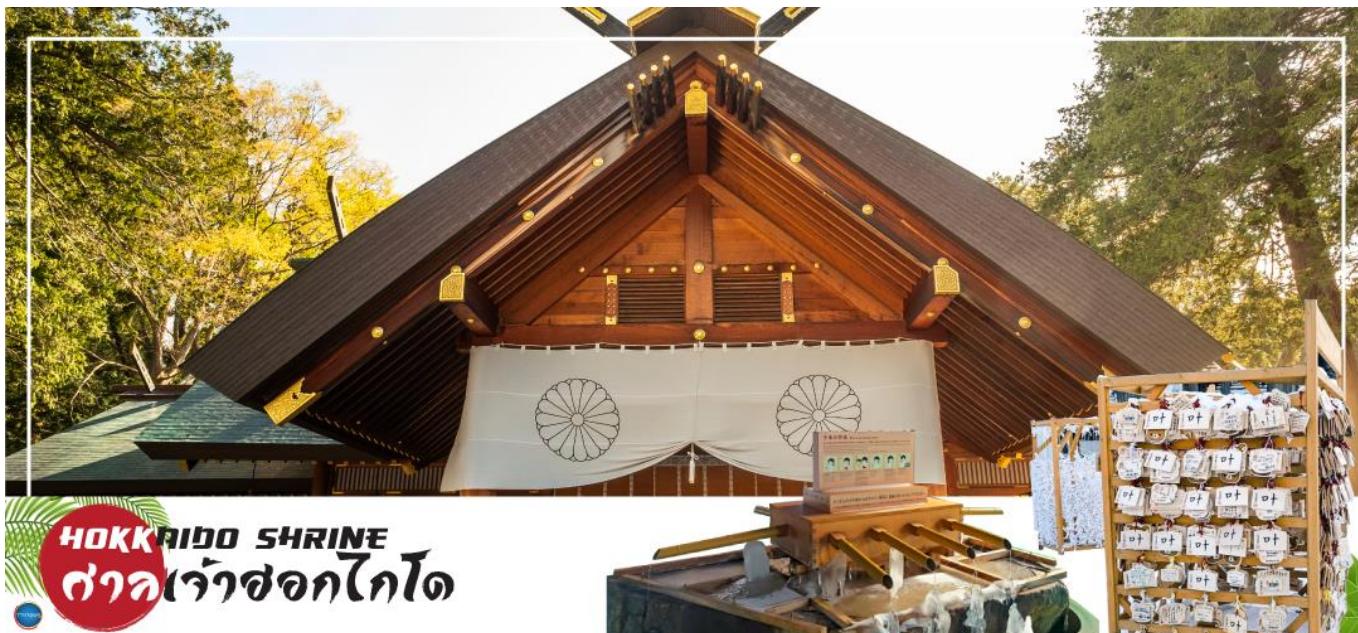
HOKKAIDO SHRINE ศาลเจ้าฮอกไกโด

นำท่านเดินทางสู่ ย่านซุซุกิโนะ(Susukino) นับเป็นย่านที่เต็มไปด้วยแหล่งบันเทิงที่โด่งดังมากที่สุดของเมืองซัปโปโร(Sapporo) อีกทั้งยังเรียกได้ว่าเป็นย่านบันเทิงที่ใหญ่ที่สุดในทางตอนเหนือของญี่ปุ่นทีเดียวละคะ บอกเลยว่าอยากมาบันเทิงใจยามค่ำคืนสัมผัสไลฟ์สไตล์แบบคนญี่ปุ่นแท้ๆ ต้องมาที่นี่ให้ได้เลยละคะ เพราะเต็มไปด้วยร้านค้า บาร์ ร้านอาหาร ร้านคาราโอเกะ และตู้ปาจิงโกะ รวมกว่า 4,000 ร้าน บางร้านนี้เปิดจนถึงเที่ยงเที่ยงคืน