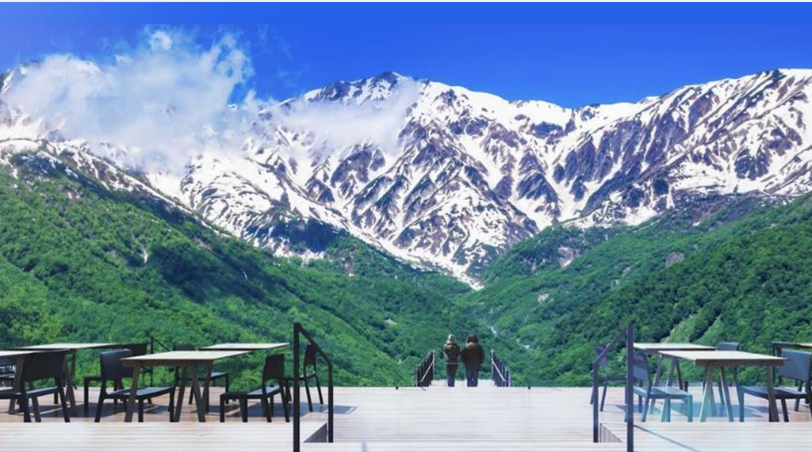
HAKUBA MOUNTAIN HARBOR

ไม่พลาดกับการชมวิวแบบพาโนรามา ณ Hakuba Mountain Harbor ด้วยทัศนียภาพที่เหนือชั้นของภูเขาโดยรอบ จุดเด่น คือ ระเบียง “Hakuba Sanzan” ที่สามารถเห็นเทือกเขาแอลป์แบบ 360 องศา ได้อย่างสวยงามในทุกฤดู สามารถยื่นถ่ายรูป และดื่มด่ำกับบรรยากาศได้อย่างเต็มอิม ในบริเวณเดียวกันยังมีร้านเบเกอรี่ โดยทางเข้ามีที่นั่งบนระเบียง สามารถเพลิดเพลินไปกับการจิบเครื่องดื่มอุ่น ๆ พร้อมชมบรรยากาศตามอัธยาศัย