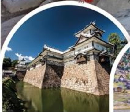
ปราสาทคานาซาว่า