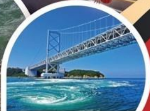
สะพานคนเดิน อุซุโนะ มิชิ