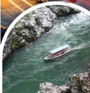
ล่องเรือในแม่น้ำช่องเขาโอโตะ