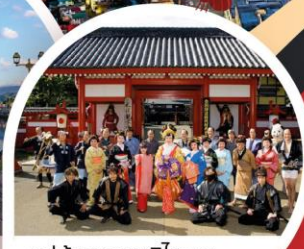
หมู่บ้านดาเตะจิโดมูระ

ซิดาเซ่ • โนโบริเทส • ฮาโกดาเตะ • โอตารุ • ซัปโปโร