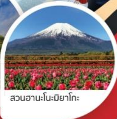
สวนฮานะโนะมียาโกะ