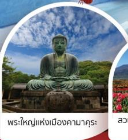
พระใหญ่แห่งเมืองคามาคุระ