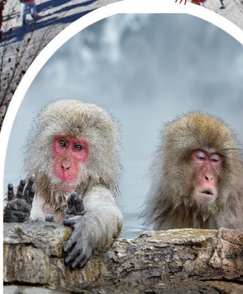
สวนลิงจิกคุดานิ