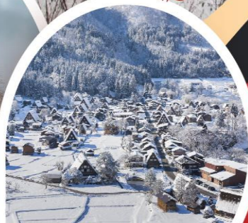
หมู่บ้านชิราคาวาโกะ (จุดชมวิวยชิโรยาม่า)