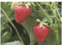
สตอเบอร์รี่