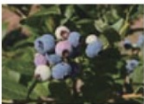
บลูเบอร์รี่