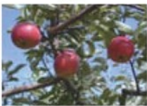
แอปเปิ้ล