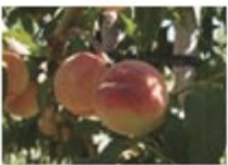
ลูกพีช(ลูกท้อ)