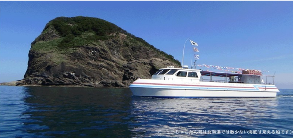
<ニューシャクタン号は北海道では数少ない海底が見える船です>