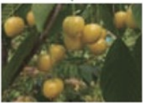
เชอร์รี่