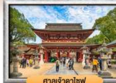
ศาลเจ้าคาโซฟู