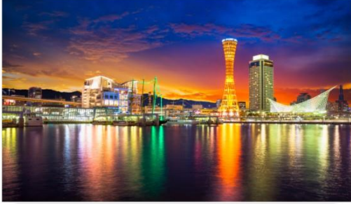
โกเบ พอร์ตทาวเวอร์