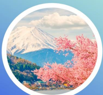
SPRING มีนาคม-พฤษภาคม 4°C - 15°C