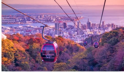
กระเช้าลอยฟ้าชินโกเบ