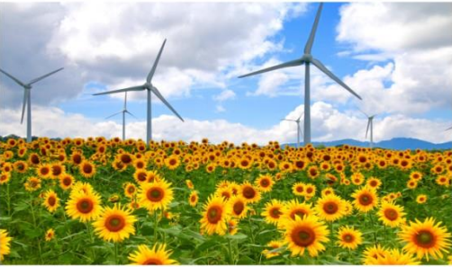
สวนนุโนะบิกิ