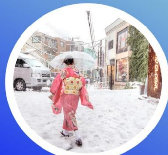
WINTER ธันวาคม-กุมภาพันธ์ -20°C - 5°C