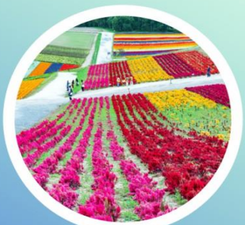
SUMMER มิถุนายน-สิงหาคม 16°C - 22°C