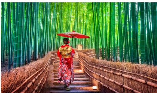
ป่าไฟอาราชิมาม่า