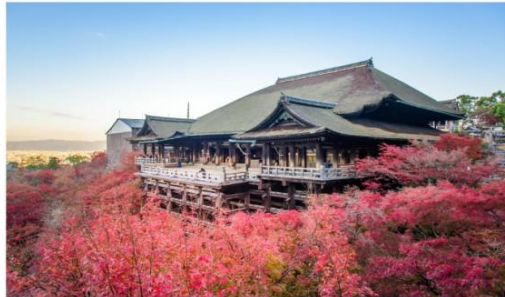
วัดน้ำใสคิโยมิซุ