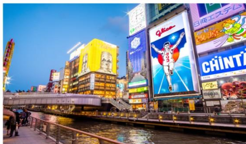
ย่านชินไซบาชิ