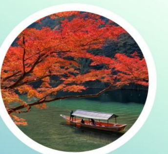
AUTUMN กันยายน-พฤศจิกายน 5°C - 20°C