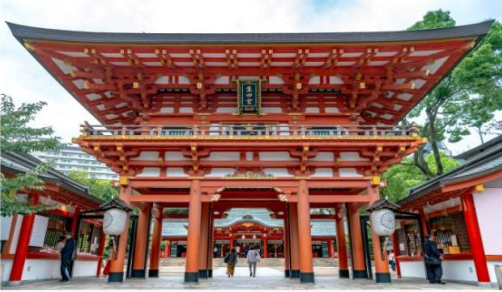
ศาลเจ้าอิคุตะ