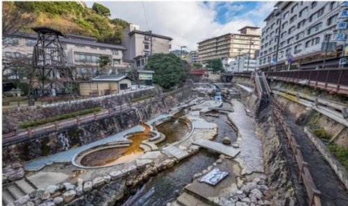
อาริมะออนเซ็น