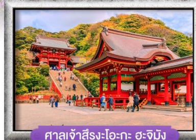
ศาลเจ้าสีรุงะโอะกะ อะจิมีง