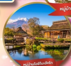
หมู่บ้านโอชิโนะฮักโก