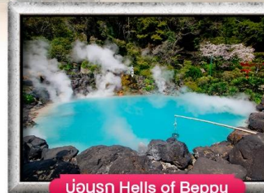
บ่อน้ำ Hells of Beppu

พิเศษ! บุฟเฟ่ต์ปิ้งย่างยากินิกุ, บุฟเฟ่ต์ชาบู