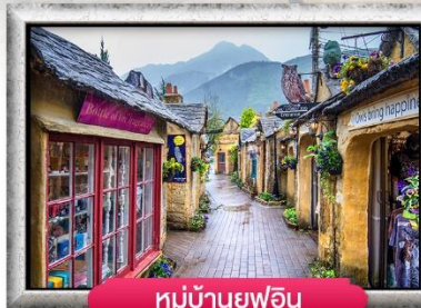
หมู่บ้านยูฟูอิน