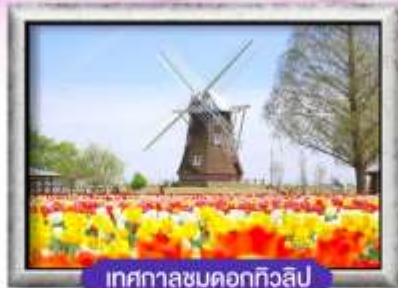
เทศกาลชมดอกทิวลิป