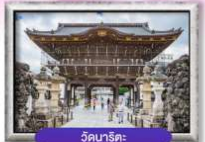
วัดนาริตะ